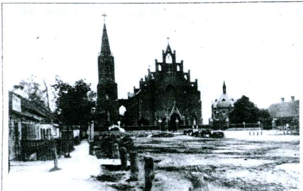
Rokiškis prieš Pirmąjį pasaulinį karą.