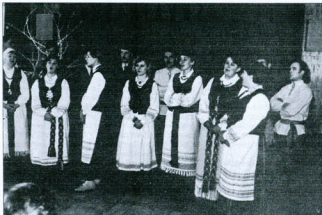
Folklorinis ansamblis "GASTAUTA".

Nedaug teko lauti, kuriuos gal didžiūti ir dabar užrašomas bei renkamas liaudies kūrybos turtais. Prabėgęs pora dešimtmečių, ir mes, lietuviai, senųjų lobių ieškojime dainynuose, archyvuose, muziejuose. Todėl smagu, kad ir Rokišio žemė išaugino daug talentingų muzikantų, dainininkų, pasakorių, Rokišio etnokultūros centro kataloge paminėta apie du šimtus pateikėjų, iš kurių užrašyta 1023 dainos, 4 sutartinės, 17 giesmių, apie 100 instrumentinių kūrinių, 15 pasakų, 57 pasakojimai, atsitikimai, 3 legendos. Šie lobiai surinkti mūsų folklorinio ansamblio "Gastauta" rengiamose ekspedicijose. Aplankytas bene kiekvienas rajono kampelis: nuo Onušio, Suvainišio iki Jūžintų, Duoklišio. Vien Rokišio rajone surengta 20 ekspedicijų. Nuvykta ir į Zarasų rajono Suvieko bei Salako apylinkes, Utenos rajone į Sudeikius.