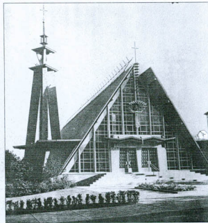
Kristaus Atsimainymo bažnyčia (architektas - J. Mulokas).

3. Architektas Jono Muloko biografija, nuotraukos, parengė Indija Jonytas. Mulokas 1984